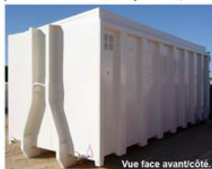
Vue face avant/côté.

(Déchets Industriels Spéciaux, Déchets Ménagers Spéciaux, Déchets Dangereux des Ménages)