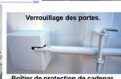
Verrouillage des portes.