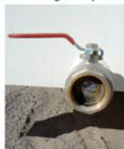
Vanne de vidange. (Option : raccord pompier).