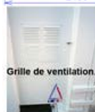
Grille de ventilation.