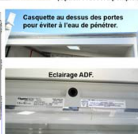
Casquette au dessus des portes pour éviter à l'eau de pénétrer.